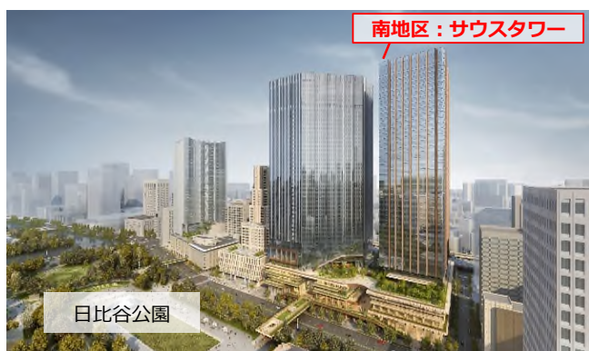
▲内幸町一丁目街区完成イメージ

本事業は、「(仮称)内幸町一丁目街区開発プロジェクト」の事業構想として本年3月に発表した「TOKYO CROSS PARK構想」のうち、「南地区」(サウスタワー等)にかかる再開発事業です。街区全体は北地区・中地区・南地区で構成され、約16haの日比谷公園とつながるとともに、都心最大級の延床面積約110万㎡を開発します。本事業(南地区)では、オフィスや商業施設、ホテル、ウェルネス促進施設を備え、比類なき街づくりの一翼を担う予定です。