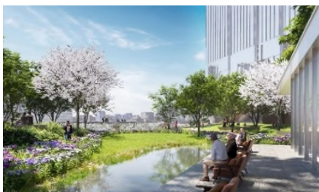
▲31m 基壇部上広場(イメージ)