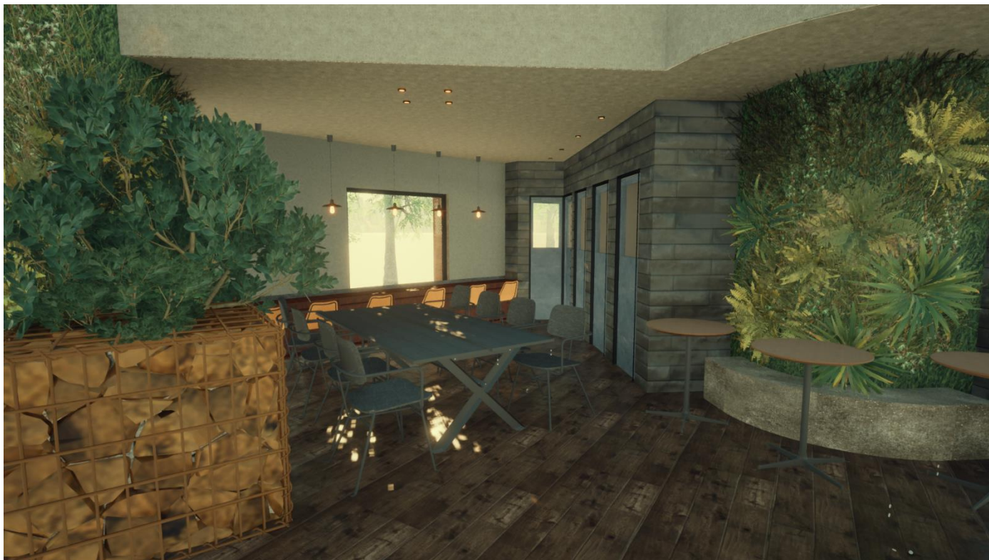
上図は施設内イメージパース